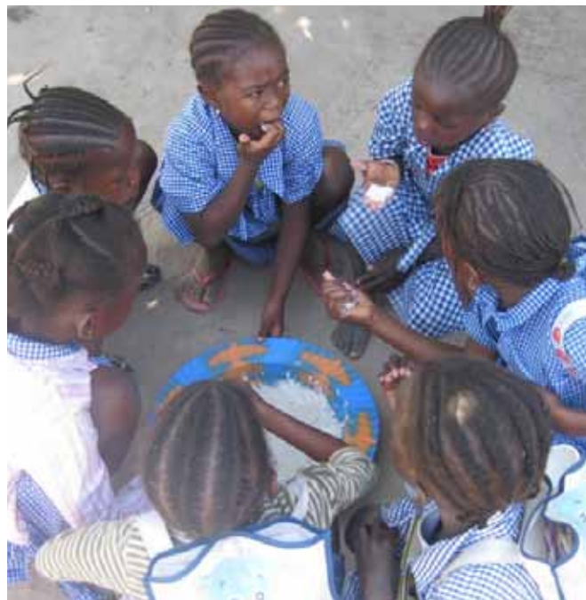
Dat is genieten!

Namens de kinderen van de J & M Roots nurseryschool willen we natuurlijk al onze vaste donateurs heel hartelijk bedanken. Mede dankzij jullie steun krijgen inmiddels ruim 60 kinderen in Madiana in Gambia onderwijs.