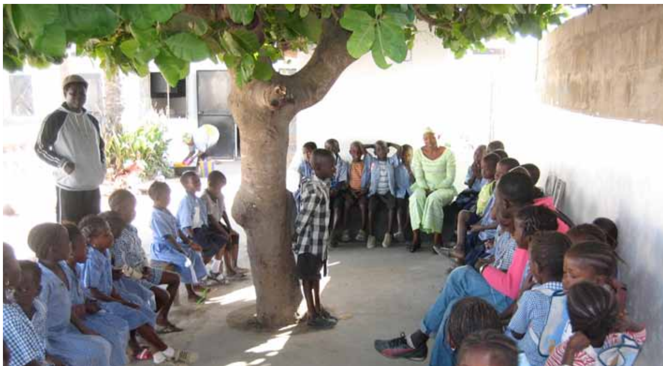
De ochtend start gemeenschappelijk in de bantaba.

In 2009 en 2010 bouwden Britse militairen in het kader van een scholingsprogramma in Gambia nieuwe lokalen voor Gambia naar school (Nieuwsbrief 2010). Op de vier helder witgeverfde lokalen had een student van de kunstopleiding in Bakau mooie muurschilderingen aangebracht. In een hoek van de speelplaats wachtten in de bantaba (verzamelplaats, waar de kinderen in de schaduw van de bladeren van een oude mangoboom de dag altijd gemeenschappelijk beginnen) de andere leerkrachten ons op.