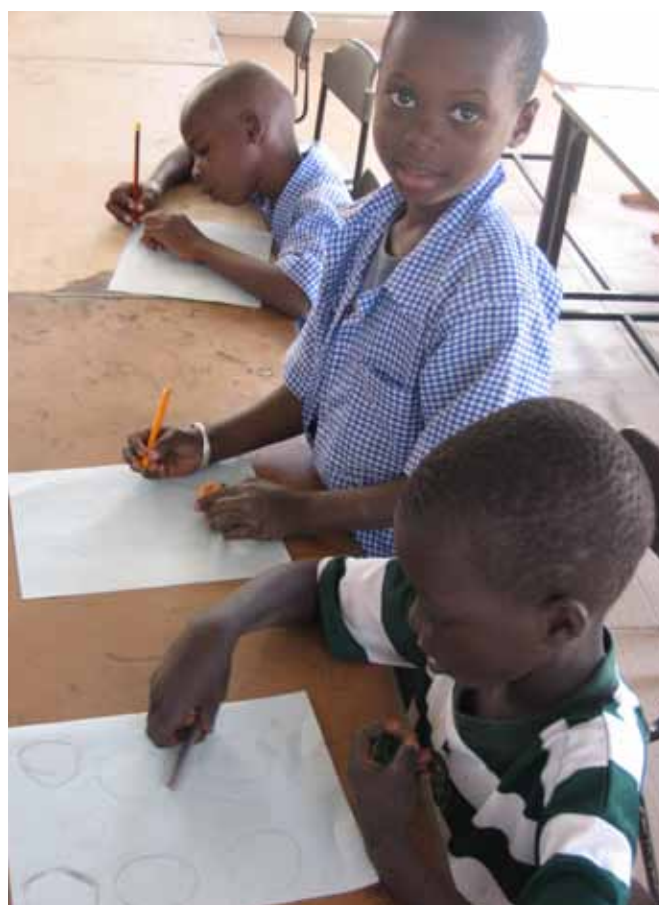
Tekenen en het benoemen van vormen