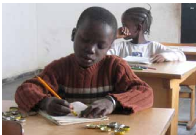
Leren rekenen met behulp van oude doppen