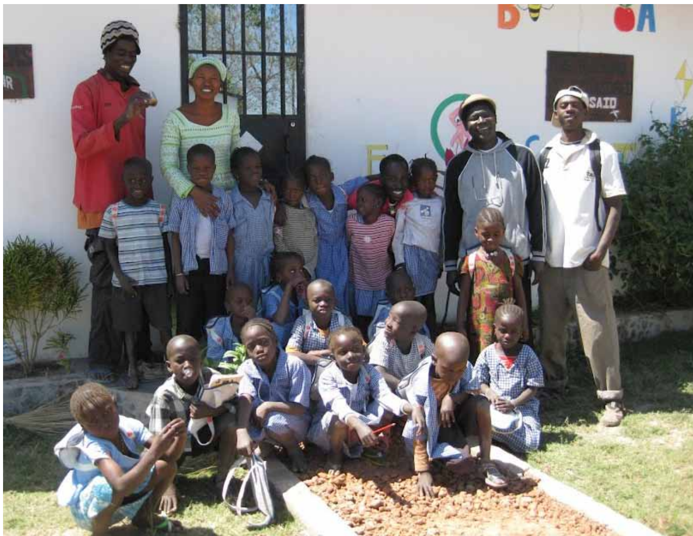
Leerkrachten en stagiaires met de kinderen uit groep 1 en 2.