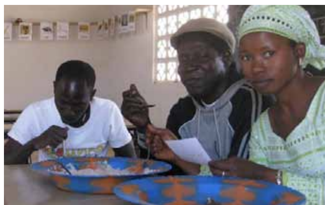
Ook voor de leerkrachten