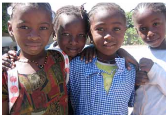
Kunnen deze vier meisjes uit groep 3 volgend jaar naar de nieuwe schakelklas?