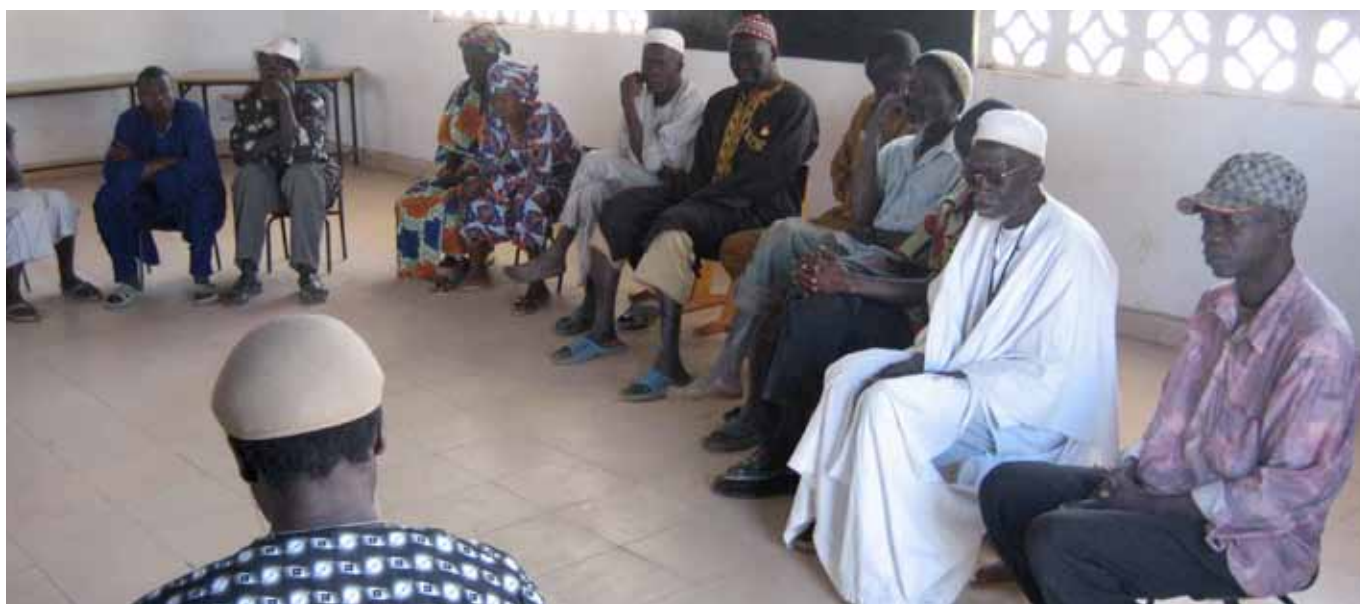
Oudermeeting in de school