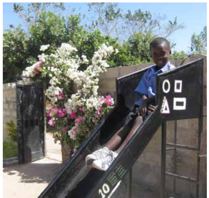
Lekker spelen op de glijbaan voor de bougainville.